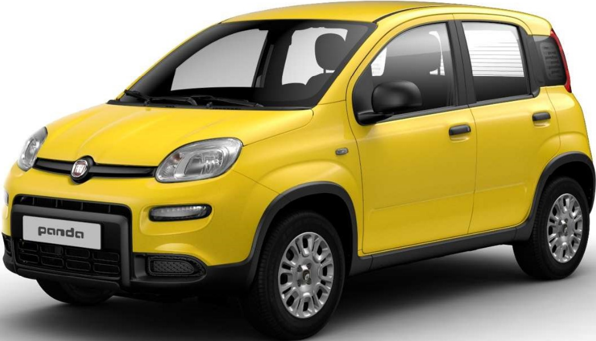
Cult & City Life