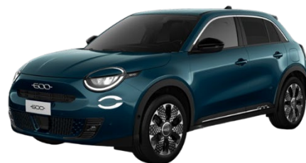
Grün - Sea of Italy