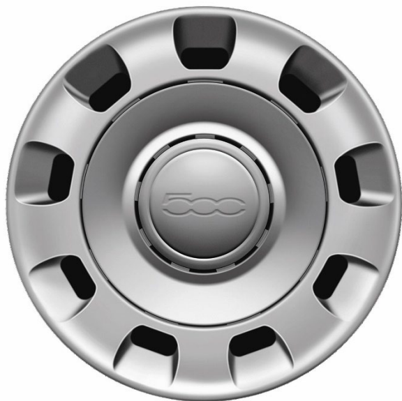
14" Stahlfelge 175/65 R14 (CULT)