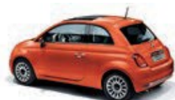
562 Spritz Orange