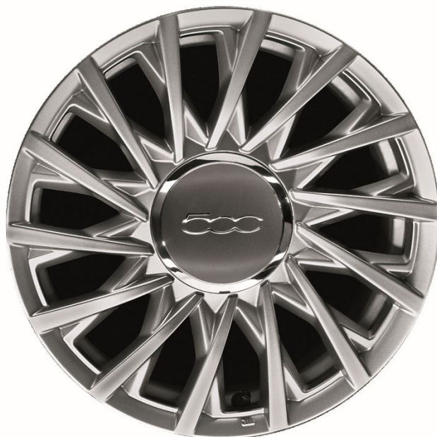
15" Leichtmetallfelge 185/55 R15 (LOUNGE)