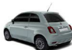
196 Rugiada Grün