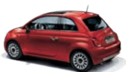
111 Passione Rot