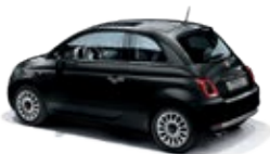
876 Vesuvio Schwarz